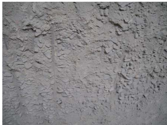
改性环氧水泥砂浆修复（左上）