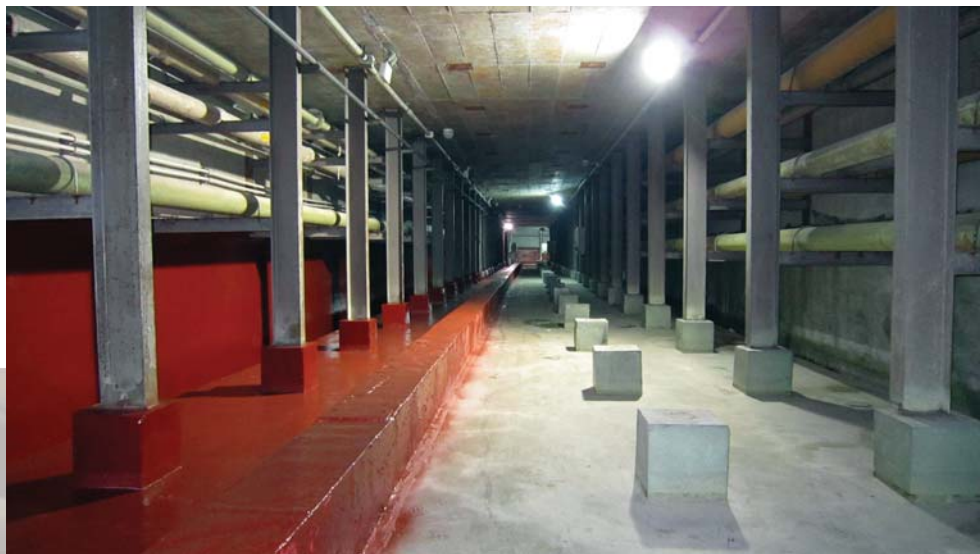
■ 上海宝钢不锈钢事业部酸液管廊围堰用Series 282 100%固含量环氧酚醛作为面漆施涂，有效防止严酷化学品的泄露和溢出。

围堰的墙面和通道部分采用了与地面同样的底漆，再配以第二道底漆 Series 218 改性环氧水泥砂浆。之后再施涂中间漆Series 61脂环族胺型环氧。最后同样再以面漆Series 282 100%固含量环氧酚醛作为终极防护。